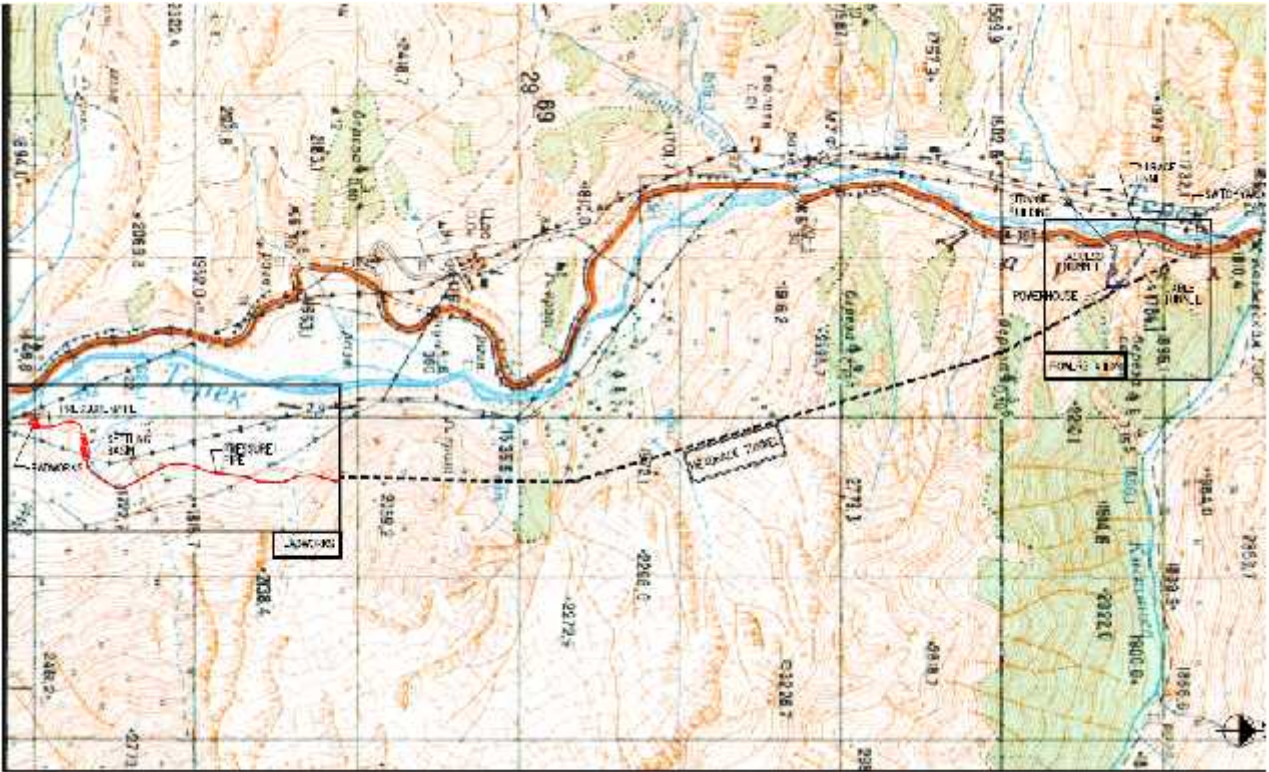
ნახაზი 2.1. დარიალი ჰესის კომუნიკაციების განთავსების სიტუაციური სქემა