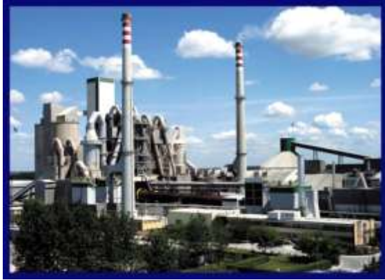
Зураг 2. Цементийн үйлдвэр