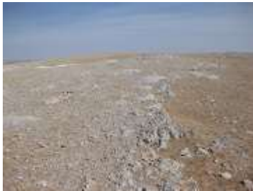
Зураг 1 Ил уурхай/шохойн чулууны илэрц

Ил уурхайн тусгай зөвшөөрлийн нийт талбай 484 гектар бөгөөд Өргөн сумаас зүүн тийш ойролцоогоор 3 км -г оршино. Шохойн чулууны нөөц нь газрын гадаргууд ил байрлах учир үйл ажиллагаа олборлолтын явцад хөрс хуулалтын ажлын хэмжээг багасгана.