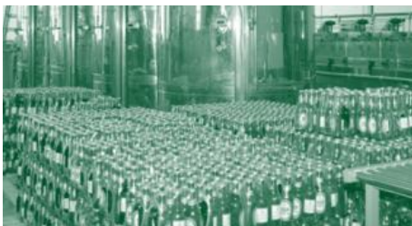
Новый маркетинговый подход помог компании Бият получить признание своего качества в Туркменистане.

Спрос на пиво высокого качества в Туркменистане значительно вырос за последние годы. В прошлом, такой спрос удовлетворялся за счет высококачественного импорта из России, когда местные марки оставались в конце списка и производили дешевое пиво более низкого качества. Компания Бият решила изменить ситуацию, и производить местное пиво равное по качеству (и превосходящее) своих импортных конкурентов.