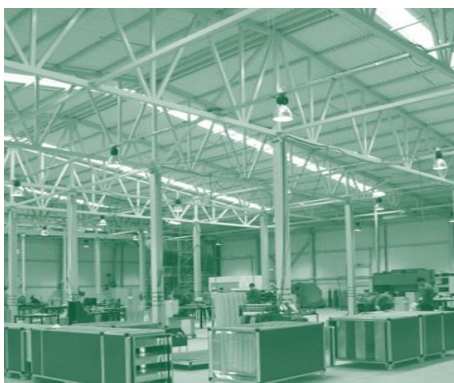
Повышение качества сделало продукцию АВЗ более конкурентоспособной на зарубежном рынке

Мы связали компанию с опытным российским консультантом ООО «Арсенал Успеха». Консультант помог АВЗ