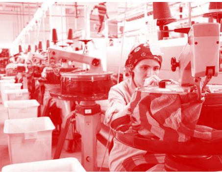
Yalın üretim tekniklerine uygun şekilde tasarlanan yeni yerleşkeye geçildikten sonra şirket daha yüksek karlılık oranına erişti.

Önceden kiralık bir üretim tesisinde faaliyetlerine devam eden Pelin Triko, 2014 yılının sonuna doğru kendisine ait bir üretim tesisine taşınma kararı aldı. Eski tesis yatay bir plana sahip olduğundan yerleşim de buna göre tasarlanmıştı. Yeni tesis 5 kattan oluştuğu için firmanın yerleşim planını dikey bir yapıya uygun hale gelecek şekilde değiştirmesi gerekiyordu. Bununla birlikte firma; üretim hattının yeniden yerleşimi ve ekipmanın uygun şekilde kurulmasını sağlayarak verimlilik elde etmeyi de hedeflemekteydi.