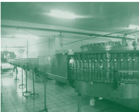
Cu ajutorul unui audit energetic complex compania a redus costurile energetice

Quantal Prima activează într-o piață foarte competitivă, principalii săi clienți fiind magazine de tip discount. Astfel, compania trebuie să găsească soluții pentru a menține costurile la un nivel scăzut. Având în vedere că producția industrială implică un consum energetic mare, energia reprezintă a doua categorie de costuri, ca mărime, după materia primă. Drept urmare, managementul companiei a decis să