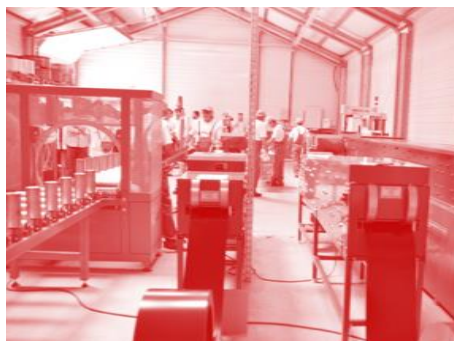
Noua organizare a introdus un sistem de compartimentare pentru diferite spații de producție

Această creștere a adus, însă, noi provocări organizaționale. Compania a experimentat o dezvoltare organică, fără a avea procedurile interne necesare coordonării noii dimensiuni a creșterii. Lipsa spațiului de depozitare clar definit făcea depozitul greu de gestionat, ceea ce provoca întârzieri ale comenzilor sau chiar pierderi de comenzi și produse. La momentul începerii colaborării noastre, compania avea 39 de angajați.