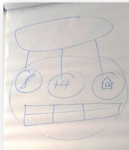
Фигура 4 – Варианти за компенсирание, представени от общността