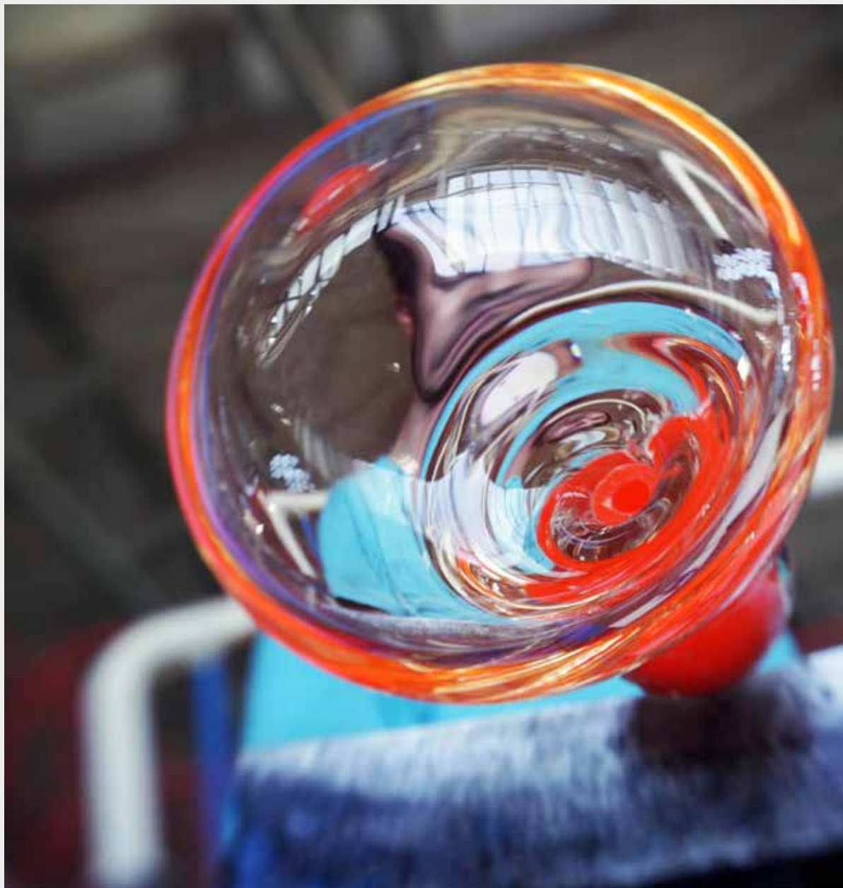
Производство стекла на одном из предприятий «Şişecam» в Турции.

В 2014 году удалось избежать образования 390 тыс. тонн отходов