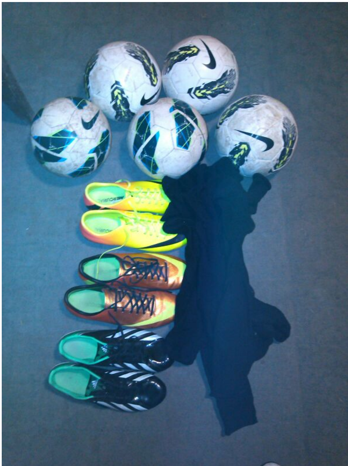
Projekat M5, slika 2 – Nabavka sportske opreme