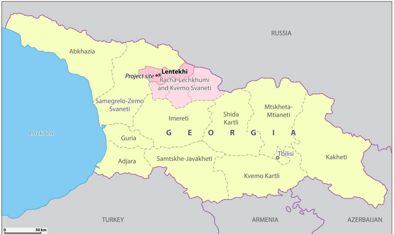
ნახაზი 1: ხელედულა-3 ჰესის ადგილმდებარეობა, საქართველო

საქართველოს მთავრობა მიზნად ისახავს ქვეყნის ჰიდროენერგო პოტენციალის განვითარებას, რათა დააკმაყოფილოს ქვეყანაში არსებული მოთხოვნა ელექტროენერგიაზე და გააუმჯობესოს ქვეყნის ენერგოუსაფრთხოება. ეროვნული ენერგო განვითარების სტრატეგიის ერთ-ერთი ნაწილია 51 მგვტ სიმძლავრის „ხელედულა-3 ჰესის“ მშენებლობა და ექსპლუატაცია რაჭა-ლეჩხუმი, ქვემო-სვანეთის რეგიონში, ლენტეხის მუნიციპალიტეტში, მდ. ხელედულასა და მდ. დევაშზე (ნახაზი 1).