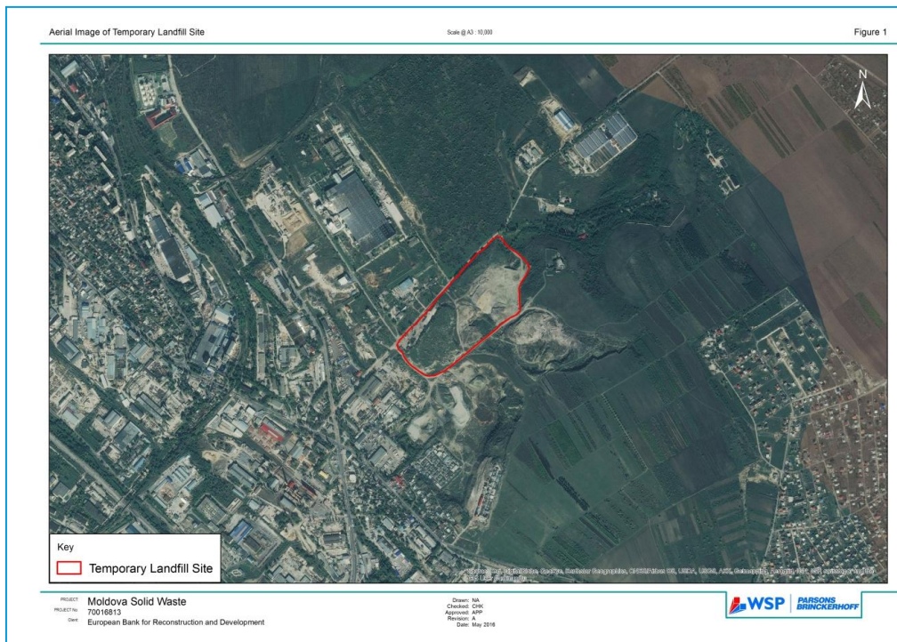
Figura 2-2 Fotografie aeriană a amplasamentului temporar de depozitare a deșeurilor din sectorul Ciocana, Chișinău