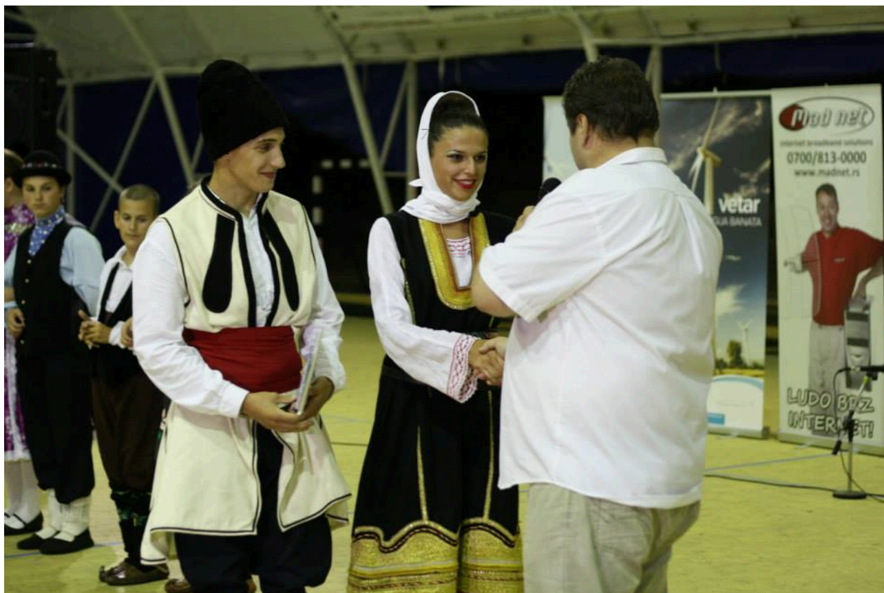
Projekat D5, slika 1 – Manifestacija Ivanjsko cveće