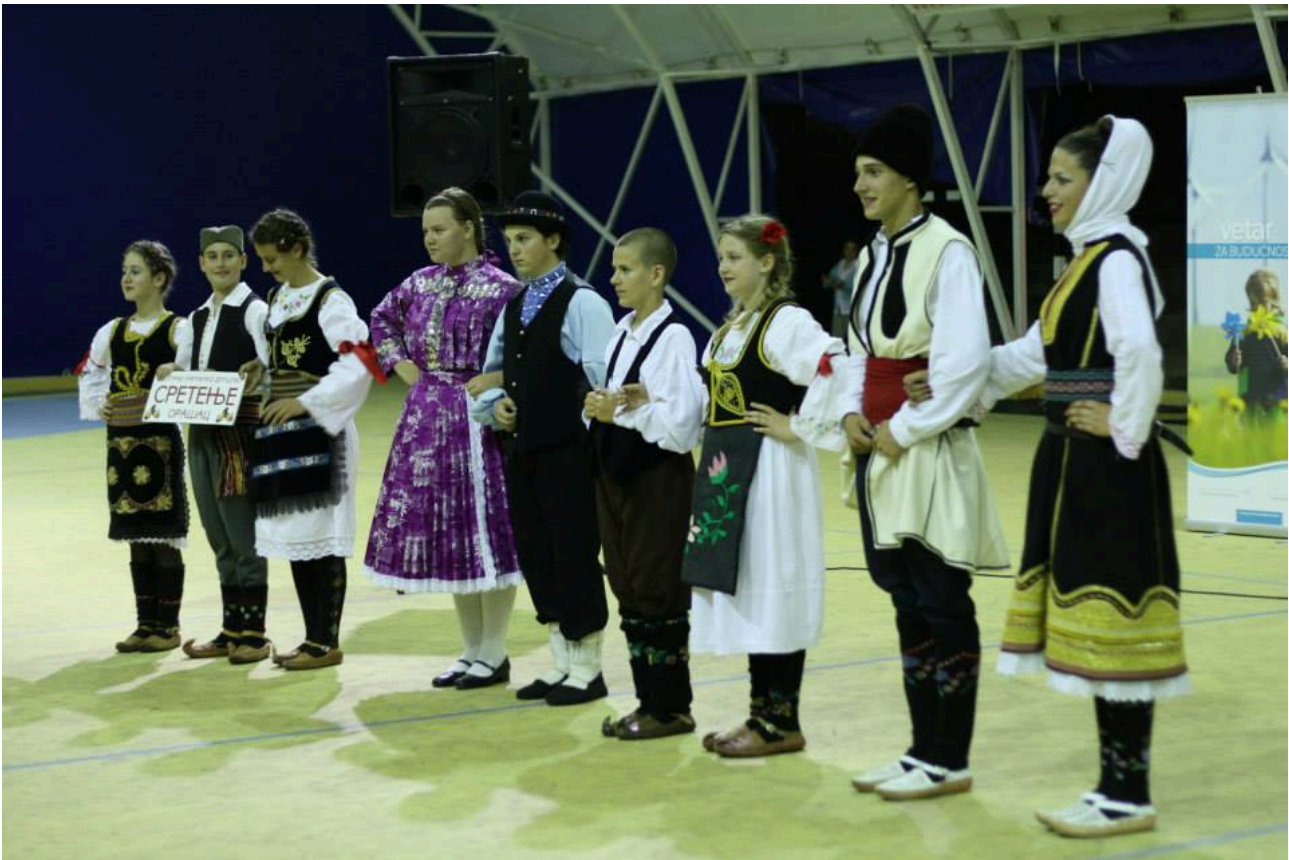
Projekat D5, slika 2 – Manifestacija Ivanjsko cveće