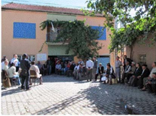
Halkın Katılımı Toplantısı (Öksüt)