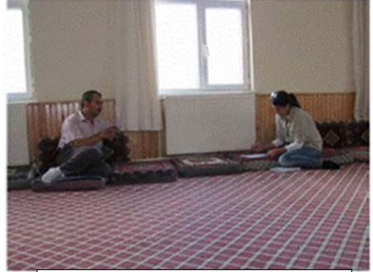
Temel Bilgilendirme Toplantısı (Sarıca)

ÖMAŞ bir halkla ilişkiler ekibi kurmuş ve Develi'de bir bilgilendirme ofisi kurmuştur. Doğrudan ve dolaylı paydaşlar ile düzenli olarak iletişim kurulması, proje planları ve gelişmeler hakkında düzenli bilgi verilmesi ve her türlü şikayet ve geri bildirim alınması için bir Paydaş Katılım Planı belirlenmiştir.