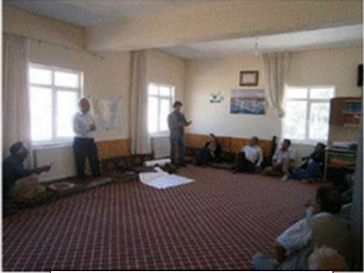
Halkın Katılımı Toplantısı (Sarıca)