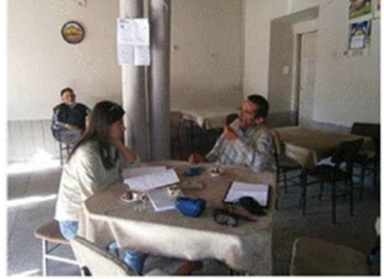
Temel Bilgilendirme Toplantısı (Öksüt)