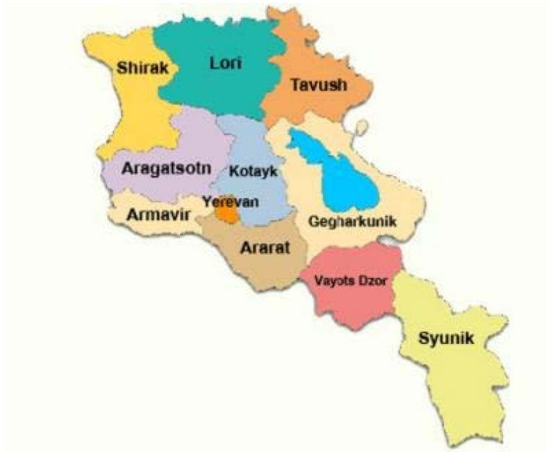
ԱԿԱՐ 2-1 Հայաստանի քարտեզը

Այս ծրագրի ընդհանուր թափանցիկ կառավարման առաջին նախագիծն է, որը Հայաստանում ֆինանսավորվում է ՎԶԵԲ-ի կողմից, և երկրում այն դառնալու է թափանցիկ կառավարման սեկտորի արդիականացման ազգային պլանի մաս: Առաջարկվում է Գեղարքունիքի մարզում տեղակայված Սևան քաղաքը, որը հյուսիսային մասով սահմանակից է Կոտայքի մարզին և մայրուղուն, նույնպես ընդգրկվի որպես ծրագրի մաս: Սևան քաղաքն ավելի մոտ է Հրազդանի աղբավայրին, քան Սևան քաղաքի առկա համայնքային աղբավայրին, որը գտնվում է Չկալովկա գյուղին մոտ: Ծրագրին այժմ նաև պետք է ներառի թափանցիկ տեղափոխման երկու կայան, որոնք տեղակայված են Գեղարքունիքի մարզում (հնարավոր է Գավառի շրջանում և Մարտունու շրջանում), թեև վայրերը դեռևս ընտրված չեն: Ծրագրին ընդգրկում է Հրազդանի առկա աղբանոցի ֆարեկավումը, այն դարձնելով տարածաշրջանային ասնիտարական աղբավայր, տարածաշրջանի մյուս վեց աղբանոցների փակումը, թափանցիկ տեղափոխման և հավաքման մեքենաների, աղբարկղերի և թափանցիկ կառավարման սարքավորումների թեռք ֆերումը, թափանցիկ հավաքման ծառայությունների համար հայտարարվող մրցույթին օժանդակելը և աղբավայրի շահագործման ընկերության հիմնադրումը: Քննարկվում են ծրագրի փոփոխությունները, ներառյալ Գեղարքունիքի մարզի և Կոտայքի մարզի բոլոր քանակելի տարածքները կոշտ թափանցիկ կառավարման միացյալ