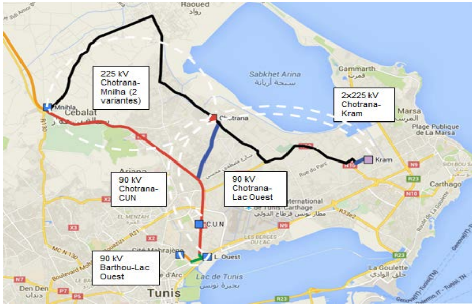
01 مفتاح الخريطة- الحصة