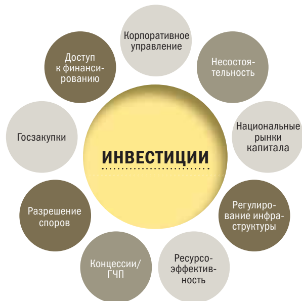
ДИАГРАММА 2 ОТРАСЛИ ПРАВА, ГДЕ ЕБРР В НАСТОЯЩЕЕ ВРЕМЯ НАЛАЖИВАЕТ ТЕХНИЧЕСКОЕ СОТРУДНИЧЕСТВО