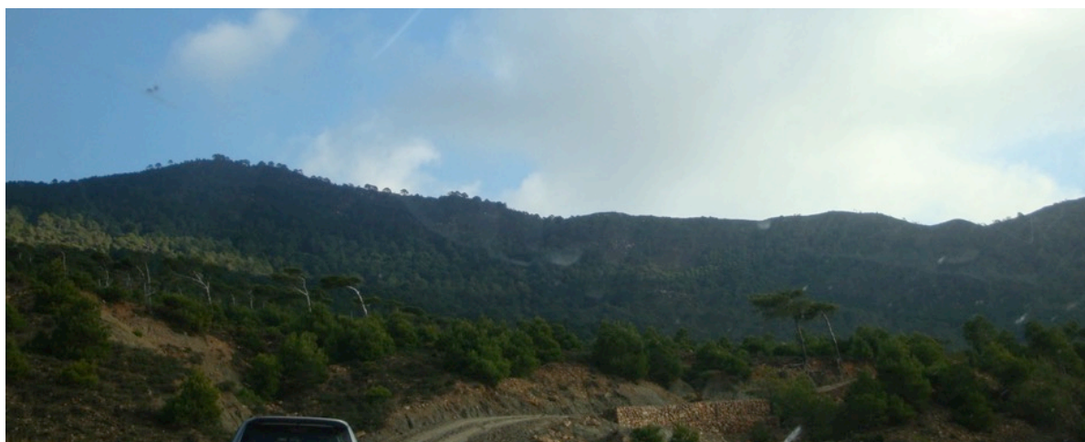
Plateau 4 Flanc est – mi section du Jbel