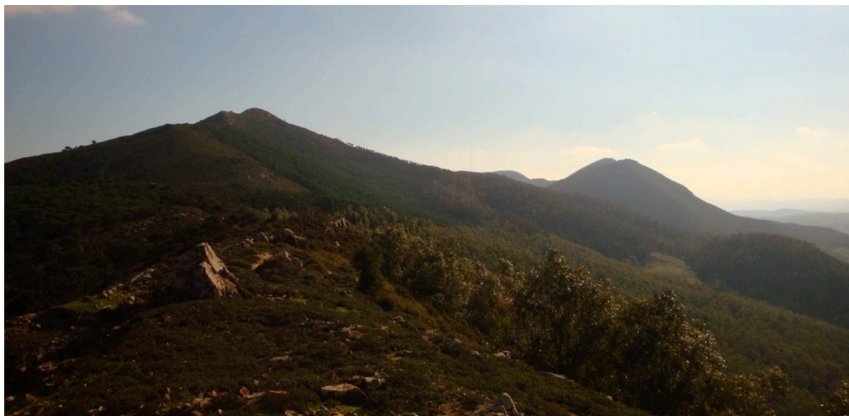
Plateau 3 Flanc ouest – mi section du Jbel