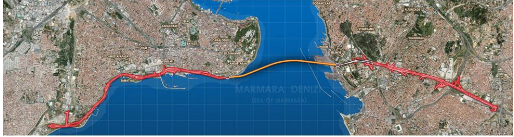
Şekil 2.1 Avrasya Tüneli Projesinin Konumu

Yaklaşım yollarının genişletme çalışmaları tamamlandığında bu yollar Belediye'ye devredilecek ve Belediye tarafından işletilecektir. Daha sonra ATAŞ tüneli, Ulaştırma Bakanlığı ile sözleşmeli olarak, ücretli geçiş uygulamasıyla yaklaşık 26 yıl boyunca işletilecektir. Proje hakkında daha kapsamlı bir tanıtım, ÇSED Raporu'nun 2. Bölüm'ünde bulunabilir (Bu bilgiler, Projenin internet sitesinde mevcuttur: www.avrasyatuneli.com ).