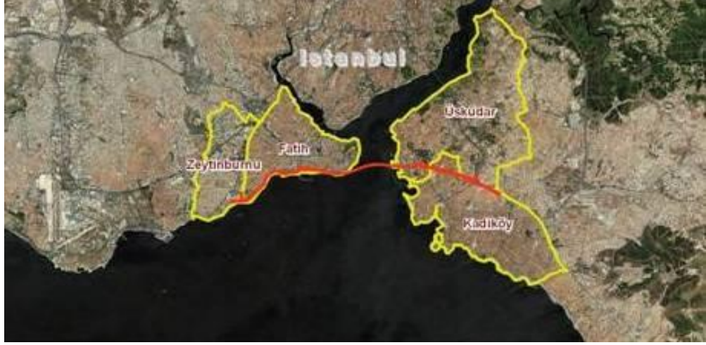
Şekil 4.1 İstanbul’un, Projeyi içine alan dört ilçesi

Bu dört ilçenin her birindeki mahalleler Ek A’da listelenmiştir.