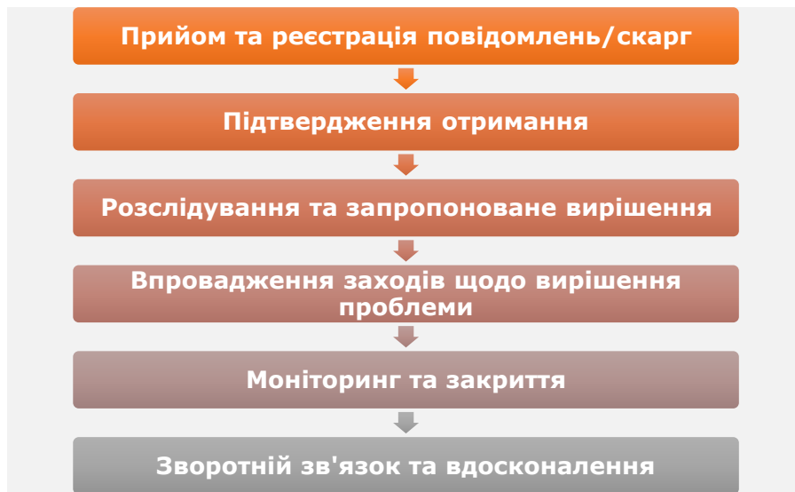
Рисунок 10-1: Процес роботи механізму розгляду скарг

Скарги та претензії працівників можуть стосуватися наступних питань (список може бути розширено залежно від конкретних обставин):