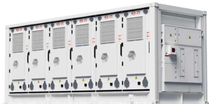
Rysunek 3-3 - Jednostka BYD typu BESS

Rysunek 3-3 przedstawia przykład jednostki BESS typu BYD, takiej jak te, które mają być zainstalowane na terenie obiektu BESS.