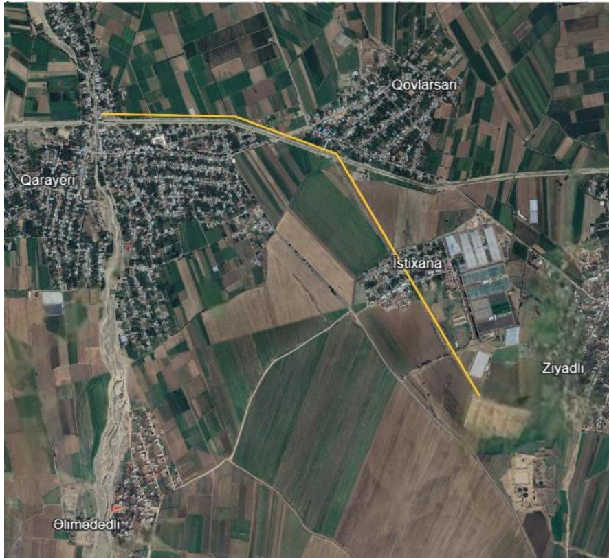
Şəkil 3. Gəncə ÇSTQ-dən suvarma kanalı və çaya qədər təklif olunan axıntı sularının axıdılması boru xətti marşrutu 12