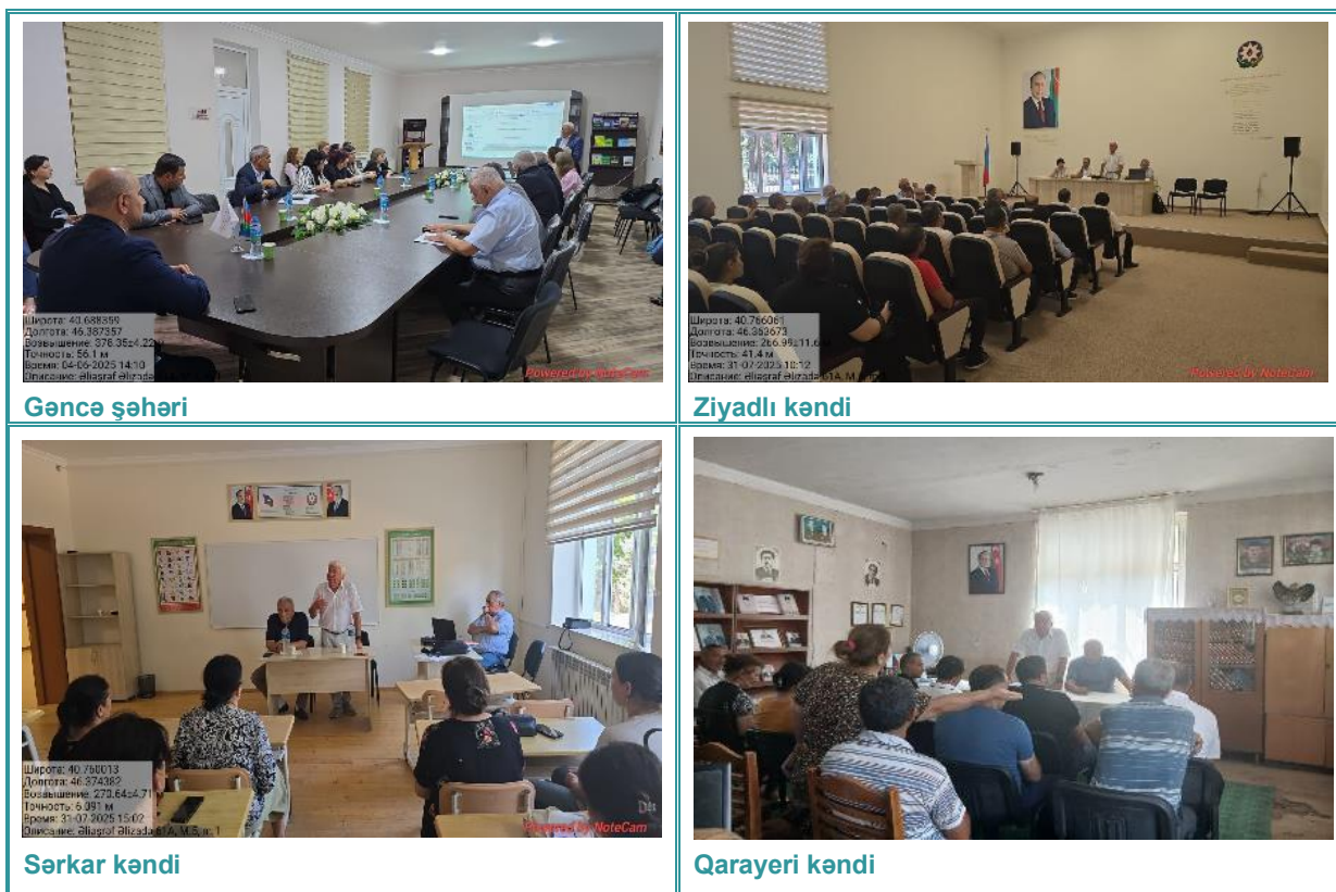
Şəkil 4. Bəzi ƏMSTQ əhatə dairəsi üzrə məsləhətləşmə görüşlərinin şəkilləri 23