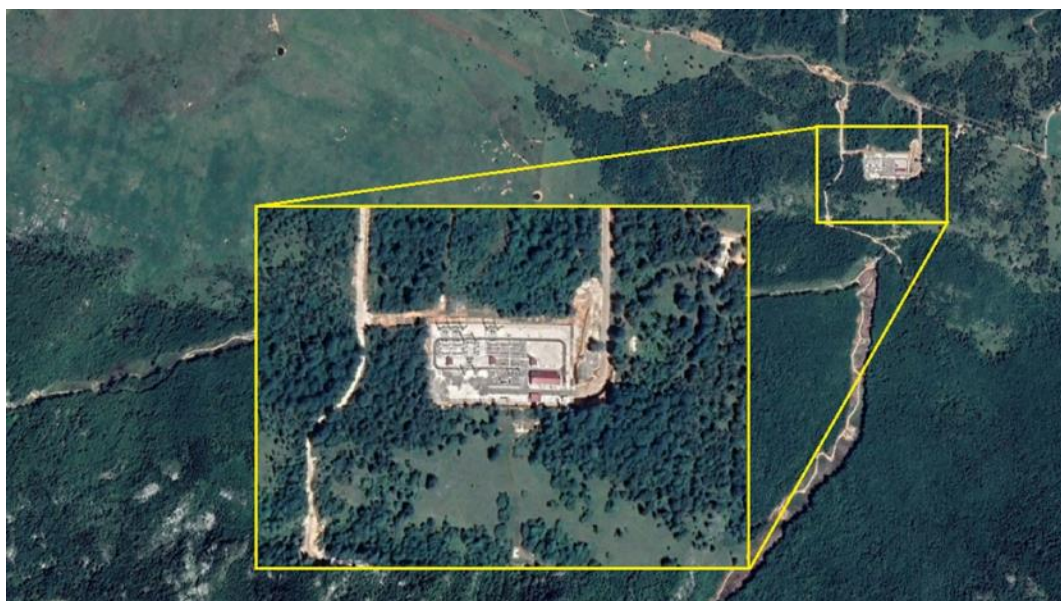
Slika 1: Ortofoto TS Brezna

Izgradnja TS Brezna osmišljena je u dvije faze. Prva faza uključivala je izgradnju 110/35 kV trafostanice, koja je završena i puštena u rad 2016. godine.