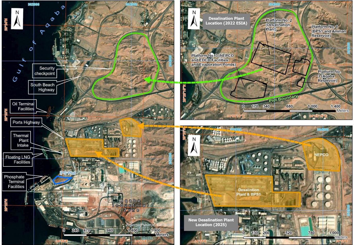
الشكل 1-1 موقع محطة تحلية المياه والمحطة الفرعية التابعة لشركة الكهرباء الوطنية (مواقع 2022 والمواقع المعدلة 2025)