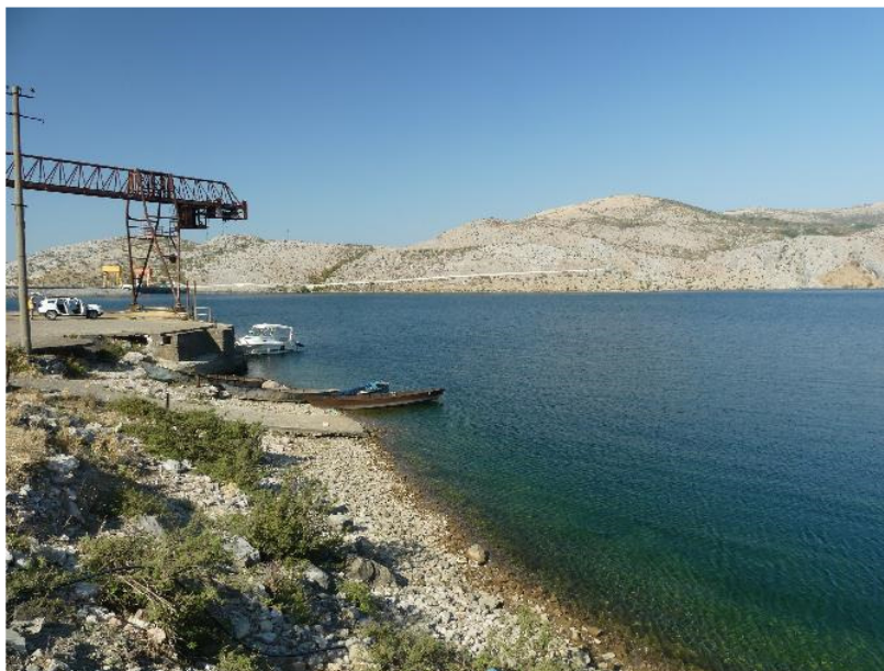
Figura 2 – Pontili ekzistues që do të përdoret për montimin, dhe gjiri ku do të lundrojë impianti FV

Projekti shtrihet rreth 400 m (por jo i dukshëm) nga shtëpitë më të afërta në Vaun e Dejes. Fare pranë zonës së montimit të impiantit ndodhet një shtëpi dhe një bar-kafe. Zona e montimit korrespondon me pontilin ekzistues dhe vinccin që përdorej për të shkarkuar mineralin e bakrit nga miniera e Komanit. Të gjithë komponentët e projektit do të vendosen në prona shtetërore, dhe blerja e tokës nuk do të jetë e nevojshme.