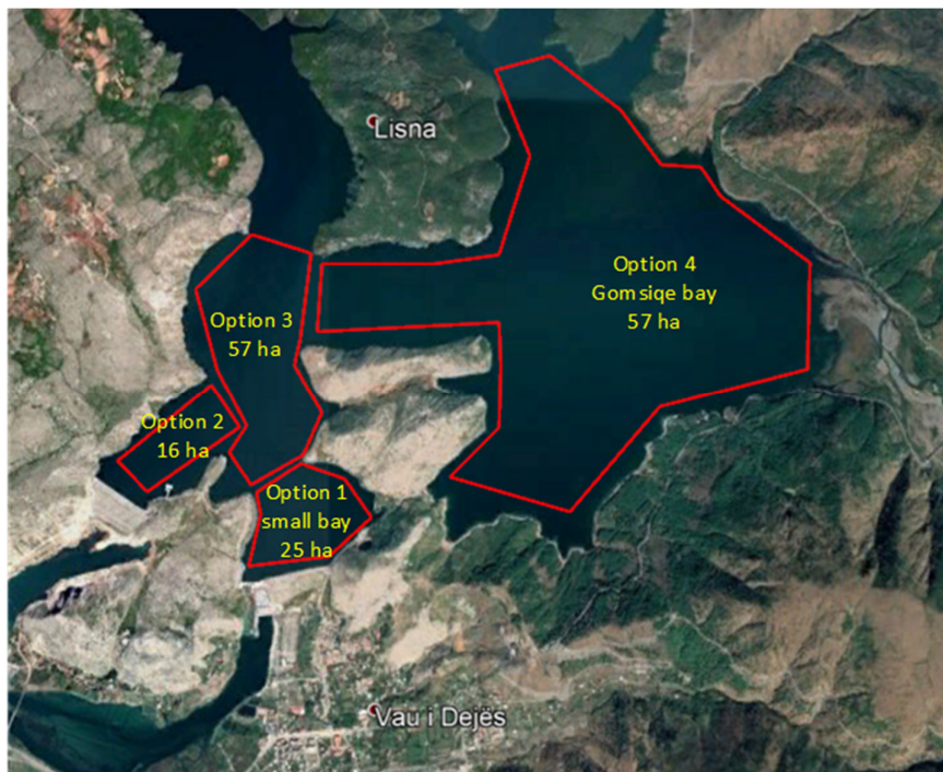
Figura 1 – Alternativat e vendndodhjeve të projektit

Për vendndodhjen e FV lundrues u shqyrtuan disa opsione. Opsioni 1, i gjendur pranë digës së Qyrsaqit, u konsiderua si opsioni i parapëlqyer, nëse do të ndërtohet në bashkërendim me Bashkinë e Vaut të Dejës në mënyrë që të sigurohet përputhshmëria me planet ekzistuese të bashkisë.