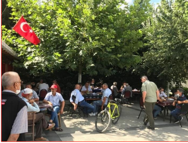
Şekil 3-1 - Topluluk Odak Grup Toplantısı