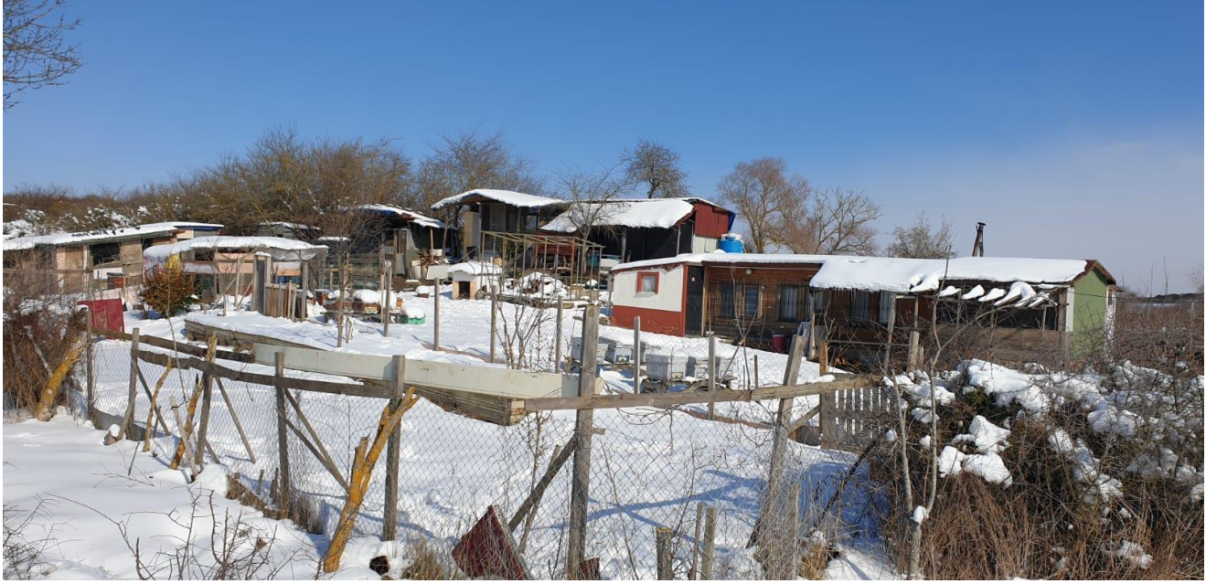
Şekil 3-3 - Arıcı tarafından kullanılan Parsel

3.2.16. Ek istişarelerin bir parçası olarak hiçbir ek savunmasız grup tespit edilmemiştir.