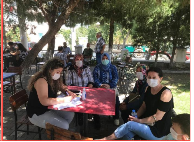
Şekil 3-2 - Kadın Odak Grup Toplantısı