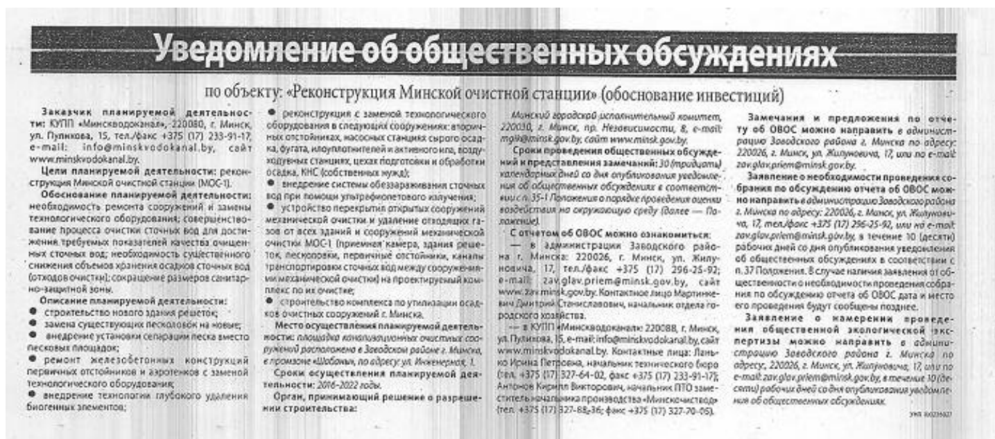
Рисунок 4.1 Объявление в газете «Минский курьер» о проведении общественных консультаций

В ноябре 2015 года УП «Минскводоканал» были организованы консультации с общественностью в рамках ОВОС в связи с намечаемой реконструкцией Минской очистной станции (т.е. с Проектом). Была создана специальная комиссия с участием представителем УП «Минскводоканал», городской администрации и организаций. Объявление о проведении консультаций было заблаговременно опубликовано в газетах «Минский курьер» и «Вечерний Минск» (см. рисунок 4.1). Также было размещено объявление на веб-сайтах Минского горисполкома и УП «Минскводоканал».