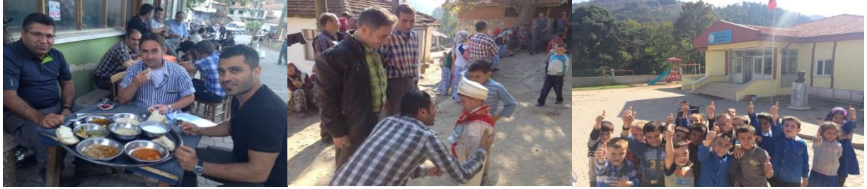
Genel Müdür ve İşletme Müdür Vekilinin okul ziyareti, köy hayrı ve sosyal aktivitelere katılımı