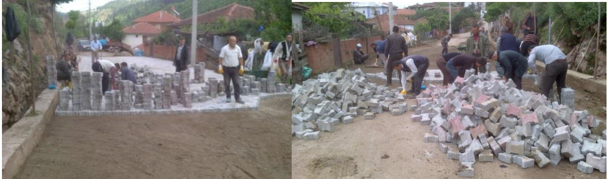
Değirmenbaşı Köy Yolu'nda köylüler ve Muhtar'la birlikte kooperatif çalışması