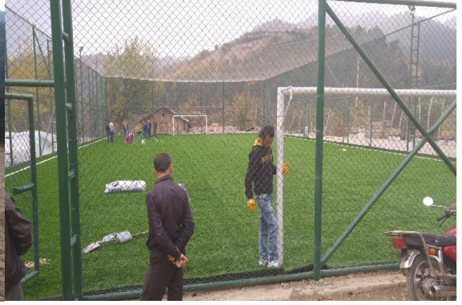
Değirmenbaşı Köyü AstroTurf futbol sahası çalışması