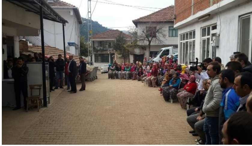
10 Kasım 2014, Balıkesir İvrindi Halkın Katılımı Toplantısı