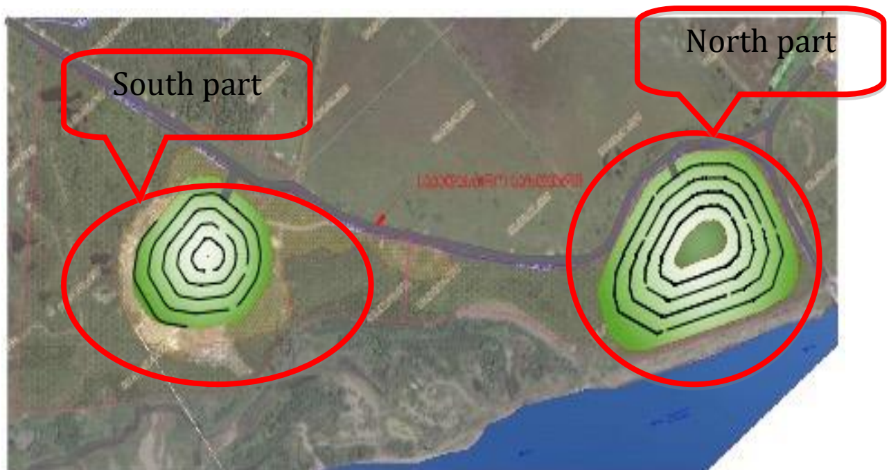
სქემა 5-1. ბათუმის ნაგავსაყრელი

კლიენტის მიერ მოწოდებული ინფორმაციის მიხედვით დაყრდნობით, ჩრდილო ნაწილი ბათუმის ნაგავსაყრელის უკვე იყო დახურული 2002 წელს. მომავალი ფორმირების და წყალგაუმტარი ფენით