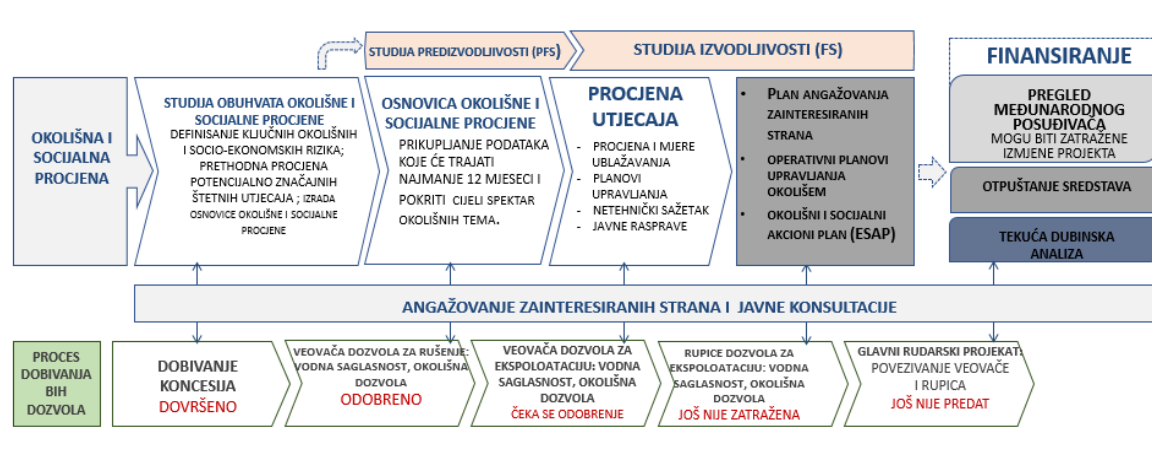
Prikaz 4.1 Proces okolišne i socijalne procjene usklađen sa tehničkim elaboratima i procesom dobivanja BiH dozvola

Konsultacije sa zainteresovanim stranama su važan dio procesa procjene okolišnog i društvenog uticaja i tehničkih studija (Prikaz 4.1). Konsultacije su inicirane za vrijeme Studije obuhvaćenosti za procjenu okolišnog i društvenog uticaja i nastavljaju se tokom osnovnog perioda. Ključne zainteresovane strane se identifikuju i intervjuiraju kao dio ovog procesa.