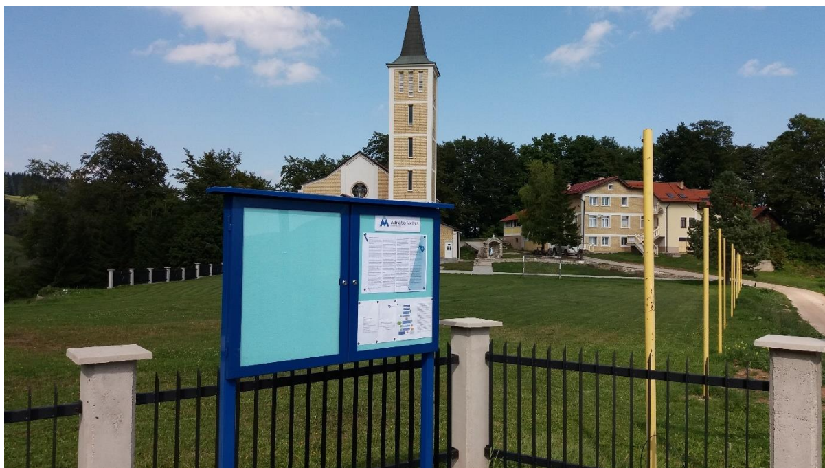
Slika 4.1.1. Oglasna tabla Borovica