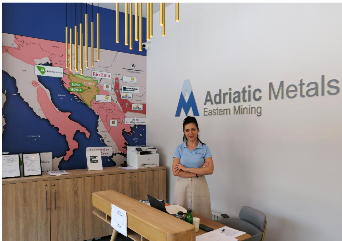
Slika 4.2 Eastern Mining Informativni Centar, Vareš

Informativni Centar rukovodi službenim žalbenim mehanizmom o kome će biti govora u Poglavlju 5 ovog Plana angažovanja zainteresiranih strana kao i službenu evidenciju angažmana zainteresovanih strana u Centru i evidenciju svih donacija, zahtjeva i sponzorstava Kompanije. Sva dokumentacija vezana za Projekat kao što je Studija obuhvata, Okolišna procjena za procedure dodjele lokalnih dozvola, netehnički sažeci svih tehničkih aspekata i evidencija dozvola će biti dostupni na zahtjev. Sve zainteresovane strane mogu podnijeti svoj zahtjev preko Informativnog Centra. Ove informacije će pomoći uposlenicima Eastern Mininga da obezbijede da svi odgovori na pitanja budu dosljedni i precizni.