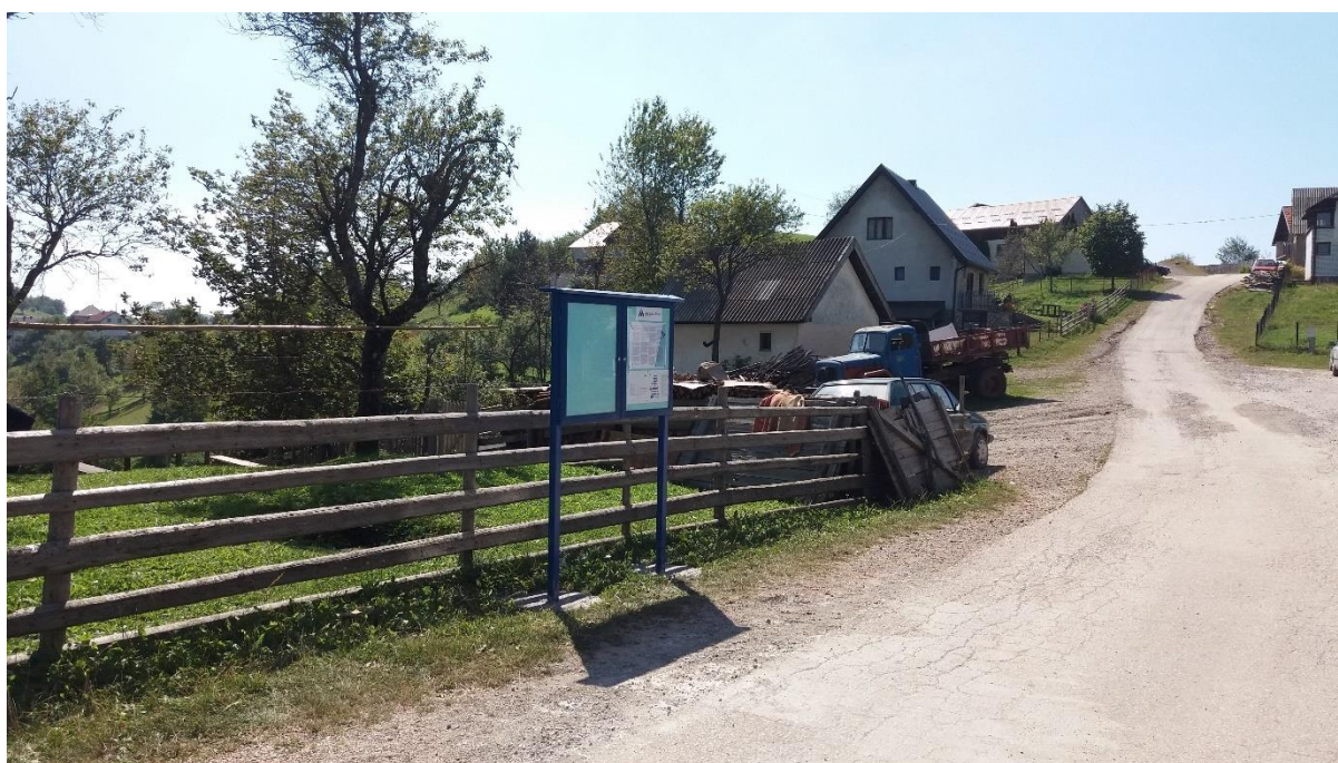
Slika 4.1.2. Oglasna tabla Daštansko