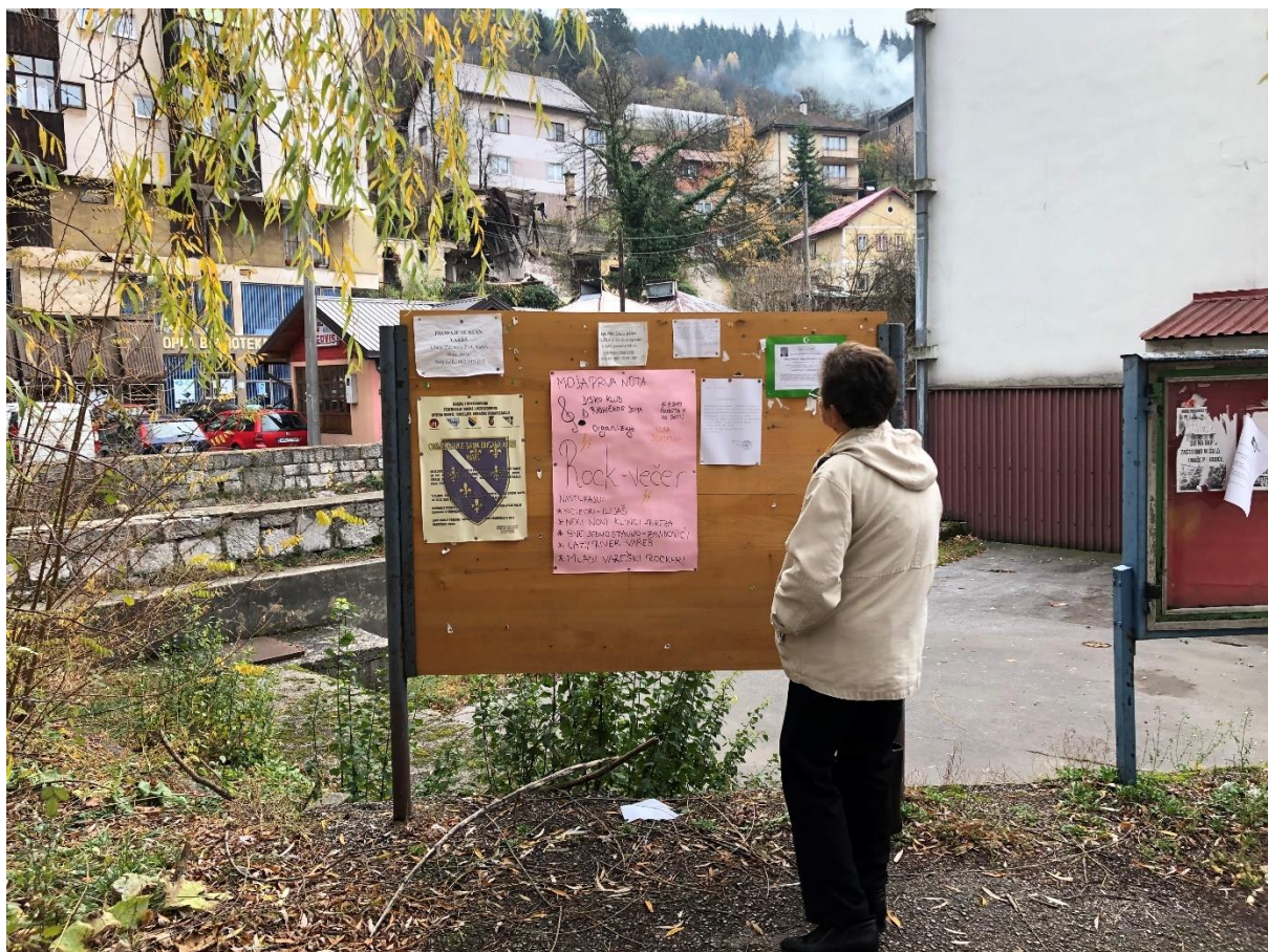
Slika 4.1 Općinska oglasna tabla u Varešu

Dokumenti i izvještaji koji su preveliki da bi bili objavljeni na oglasnim tablama će na bosanskom jeziku biti dostupni u Info Centru i bit će ih moguće preuzeti sa Eastern Mining web stranice te će biti dostupni i kod predsjednika mjesnih zajednica.