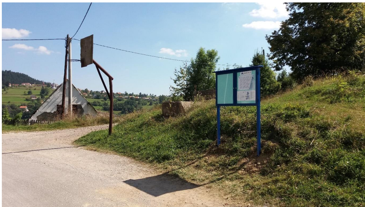
Slika 4.1.3. Oglasna tabla Pržići