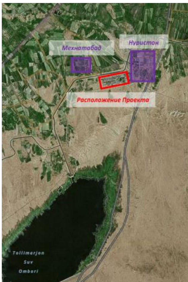
Рисунок 1: Ближайший поселок к Проекту – Нуристон, приблизительно 1 км к северо-востоку от ТЭС2. Нуристон с тех пор вырос в результате возможностей трудоустройства и местных экономических выгод (прямых и косвенных) Теплоэлектростанции Талимарджан. Мехнатабад также является соседним поселком. Ориентировочные местоположения обоих показаны на Рисунке 2.