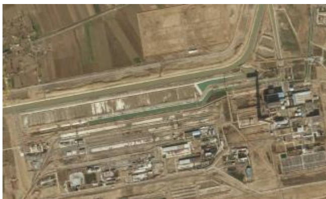
Рисунок 2: Выбор Теплоэлектростанции Талимарджан для Проекта означает, что вся заранее необходимая инфраструктура – такая как снабжение топливом, водоснабжение и механизированная откачка – уже присутствует; значительно сокращая воздействие проекта.