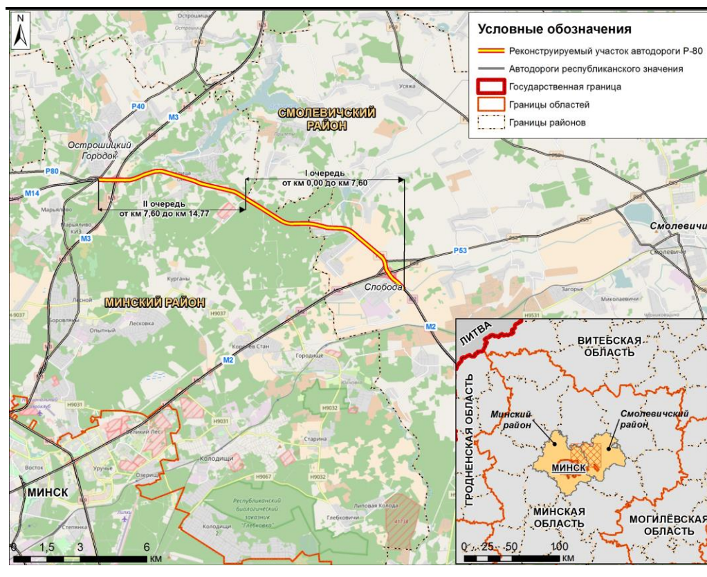
Рисунок 2.2-1 Административное устройство территории Проекта

Существующая автодорога Р-80 на реконструируемом участке проходит по территории Минского и Смолевичского районов Минской области. Минский район находится в центральной части Минской области. Административным центром района является город Минск (не входит в состав района). Смолевичский район расположен к северо-востоку от Минского района, в 35 км от г. Минск. Административным центром района является город Смолевичи (Рисунок 2.2-1).