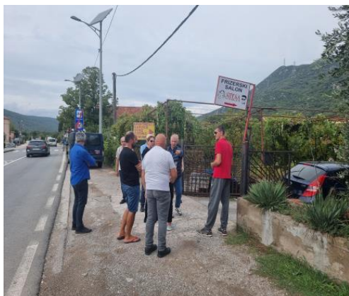
Dvorište ispred kuće koja ja predmet eksproprijacije