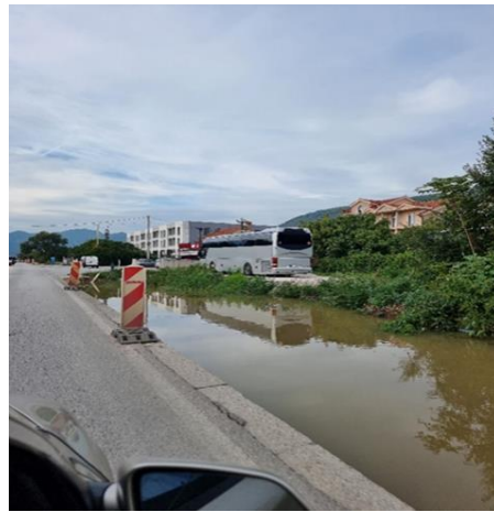
Radovi na proširenju puta, Grbalj