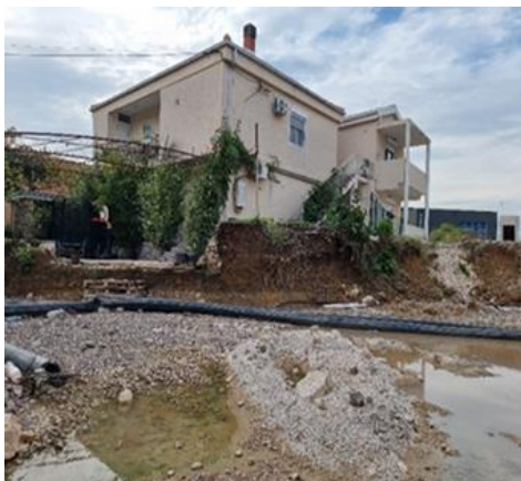
Radovi na proširenju puta blizu jedne kuće