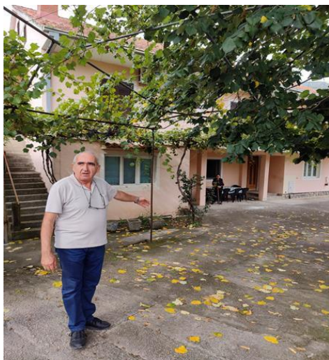
Imovina koja je predmet eksproprijacije