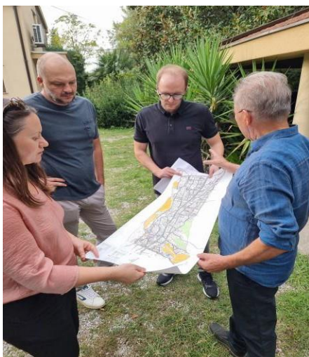
Sastanak sa Podnosiocima zahtjeva koji su pogođeni uticajem Projekta