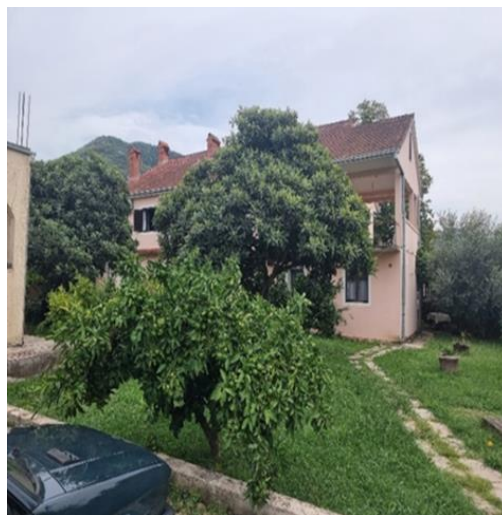
Imovina koja je predmet eksproprijacije