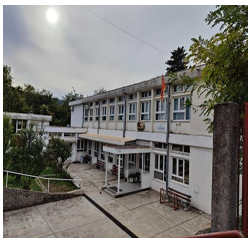
Škola u Radanovićima koja se nalazi duž puta