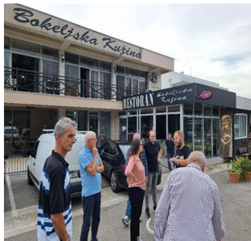
Sastanak IPAM-a sa vlasnicima pogođenim projektom, Radanovići