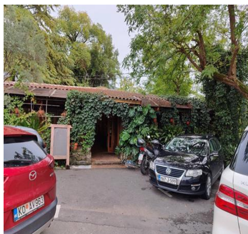
Parking restorana koji je predmet eksproprijacije Lastva Grbaljska