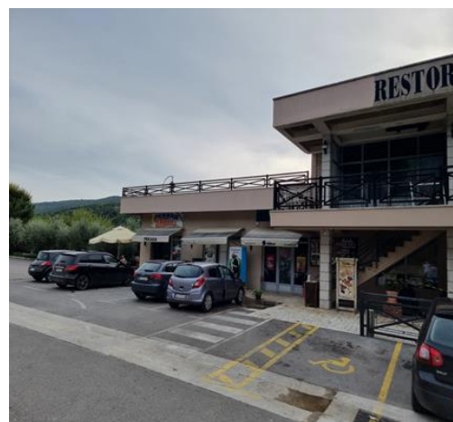
Parking restorana koji je predmet eksproprijacije, Radanovići