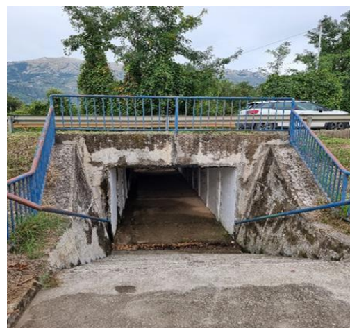
Podzemni prolaz ispred škole u Radanovićima