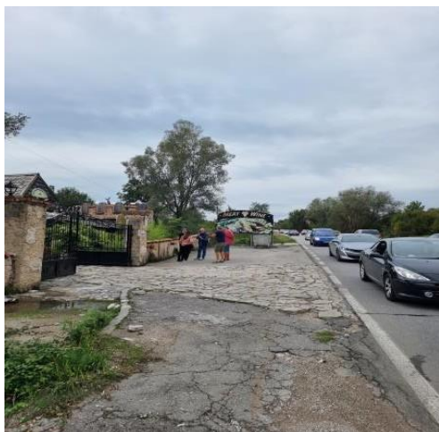
Parking restorana koji je predmet eksproprijacije, Lastva Grbaljska