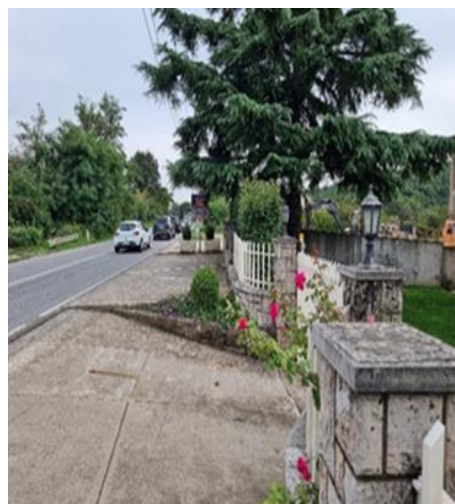
Dvorište ispred kuće koje je predmet eksproprijacije