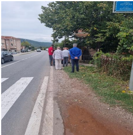
Put u Grblju koji će biti proširen sa 2 na 4 trake