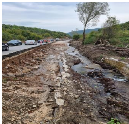
Radovi na proširenju puta u Radanovićima