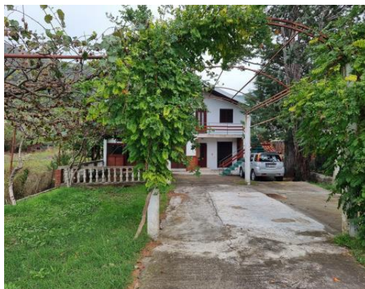
Dvorište ispred kuće koja ja predmet eksproprijacije