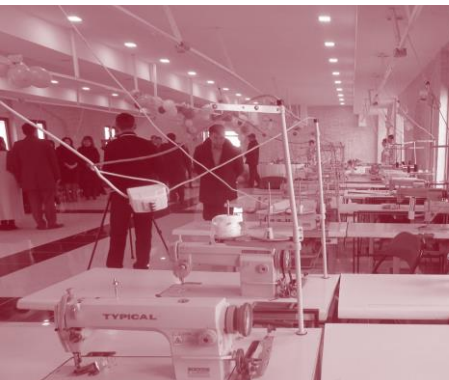
Заманбап технология менен жаңы моделди киргизүүгө мурункудай 14 эмес 3 күн кетет.

Ишкана бизге бир катар көйгөйлөр менен кайрылды. Биринчиден, аларда бардык лекалдар колго жасалып, так эместикке, чийки заттын ашыкча корошуна, өндүрүштүк каталарга алып келип, кийимдин 10-15%ынын сапаты талапка жооп бербей калчу. Экинчиден, лекалдарды колго жасоо өлчөмдөрдү өзгөртүүдө жумушчулардын убакытын көп алып, өндүрүштү басаңдатып,